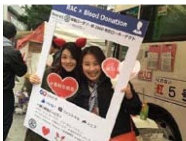
SNS パネルの使い PR